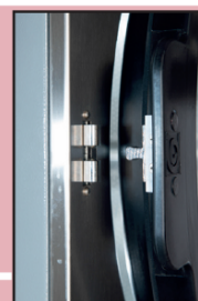
Chiusura motorizzata lavatrice

La lavatrice dispone di un pulsante d'emergenza che, se premuto, toglie l'alimentazione alla macchina.